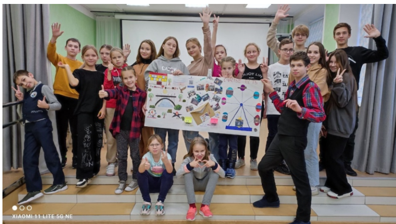
Мероприятие проекта «Школа доброжелательных отношений» в МАОУ «СОШ № 14» г. Перми