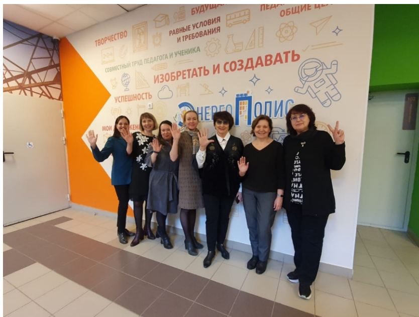
Команда экспертов проекта «Школа доброжелательных отношений»