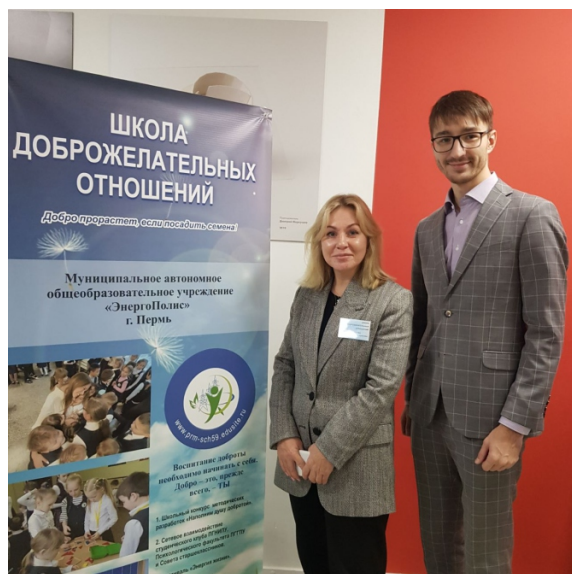
Стендовый доклад специалистов МАОУ «ЭнергоПолис» г. Перми на II городском форуме «Школа доброжелательных отношений»