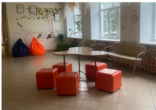
Доброжелательная среда в МАОУ «Лицей № 8» г. Перми