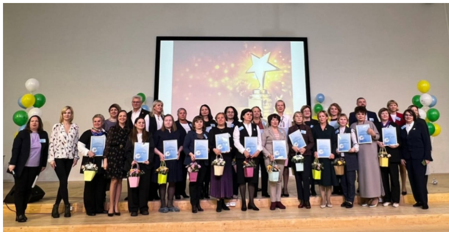
Руководители образовательных организаций — участников проекта «Школа доброжелательных отношений» 2022 и 2023 гг.