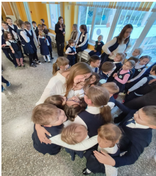
Веселые перемены в МАОУ «ЭнергоПолис» г. Перми