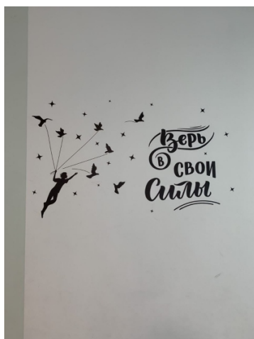
Доброжелательная информационная среда в МАОУ «Многопрофильная школа «Приоритет» г. Перми