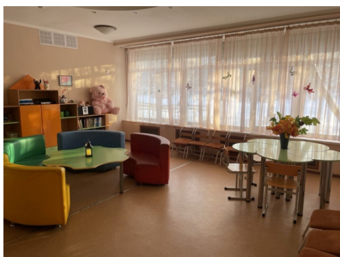
Психолого-педагогическая служба в МАОУ «Гимназия № 31» г. Перми