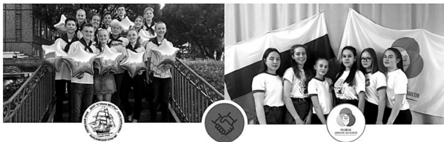
Детское школьное объединение «Страна Мечты»